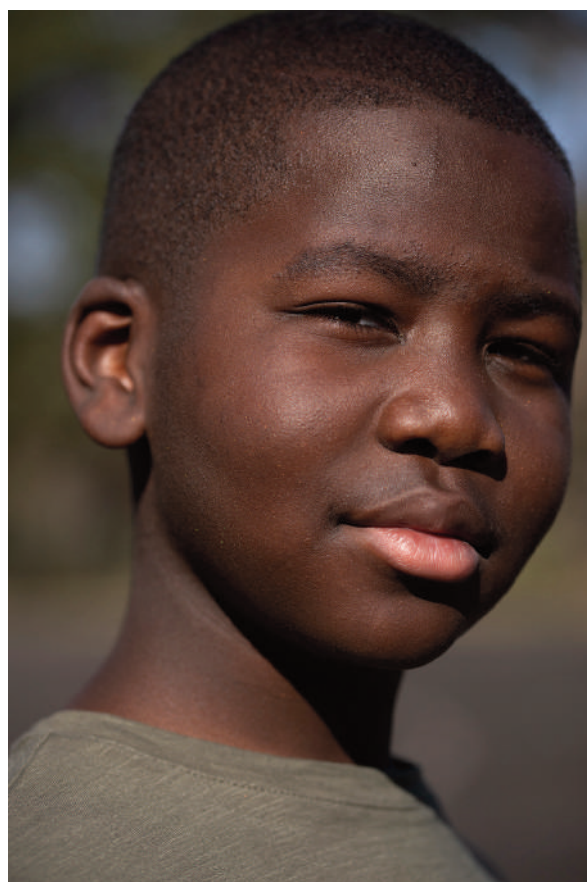
P comme Photogénique © classe CE2 de l'école élémentaire Pierre Coulon de Vichy. Portrait(s) - Edition 2021