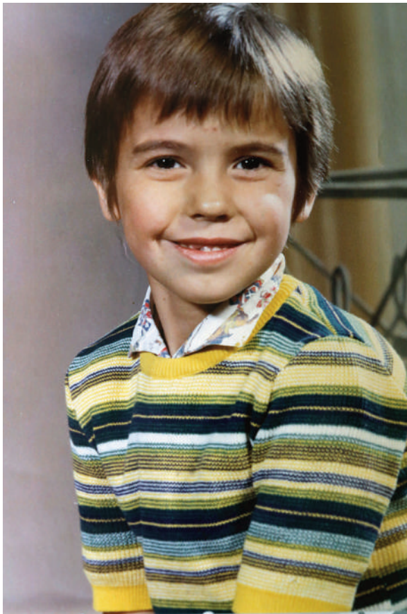
Photographie scolaire, années 1970

Patrick Bard est représenté par Signatures, maison de photographes, Paris.