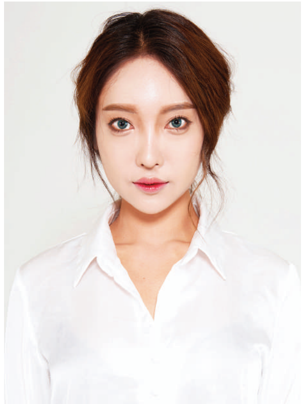
Min, Séoul. Série Fake i Real Me . 2017