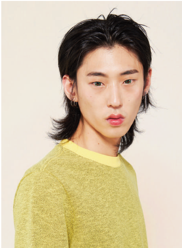
Hyenjae, Séoul. Série Flower Beauty Boys . 2018

Corinne Mariaud s'intéresse à la représentation des corps. S'adonner à toutes les métamorphoses dans le but de déconstruire les codes de genres comme les codes sociaux, telle est l'obsession de jeunes asiatiques dont elle a dressé les insaisissables contours dans deux séries emblématiques : Fake i Real Me (2017) réunit des portraits de jeunes filles prêtes à tout - chirurgie esthétique, lentilles de contact, coloration de cheveux - afin d'atteindre leur idéal de beauté ; Flower Beauty Boys (2018), rassemble des portraits de garçons non binaires usant du maquillage de façon à mettre à mal les clichés de la virilité traditionnelle.