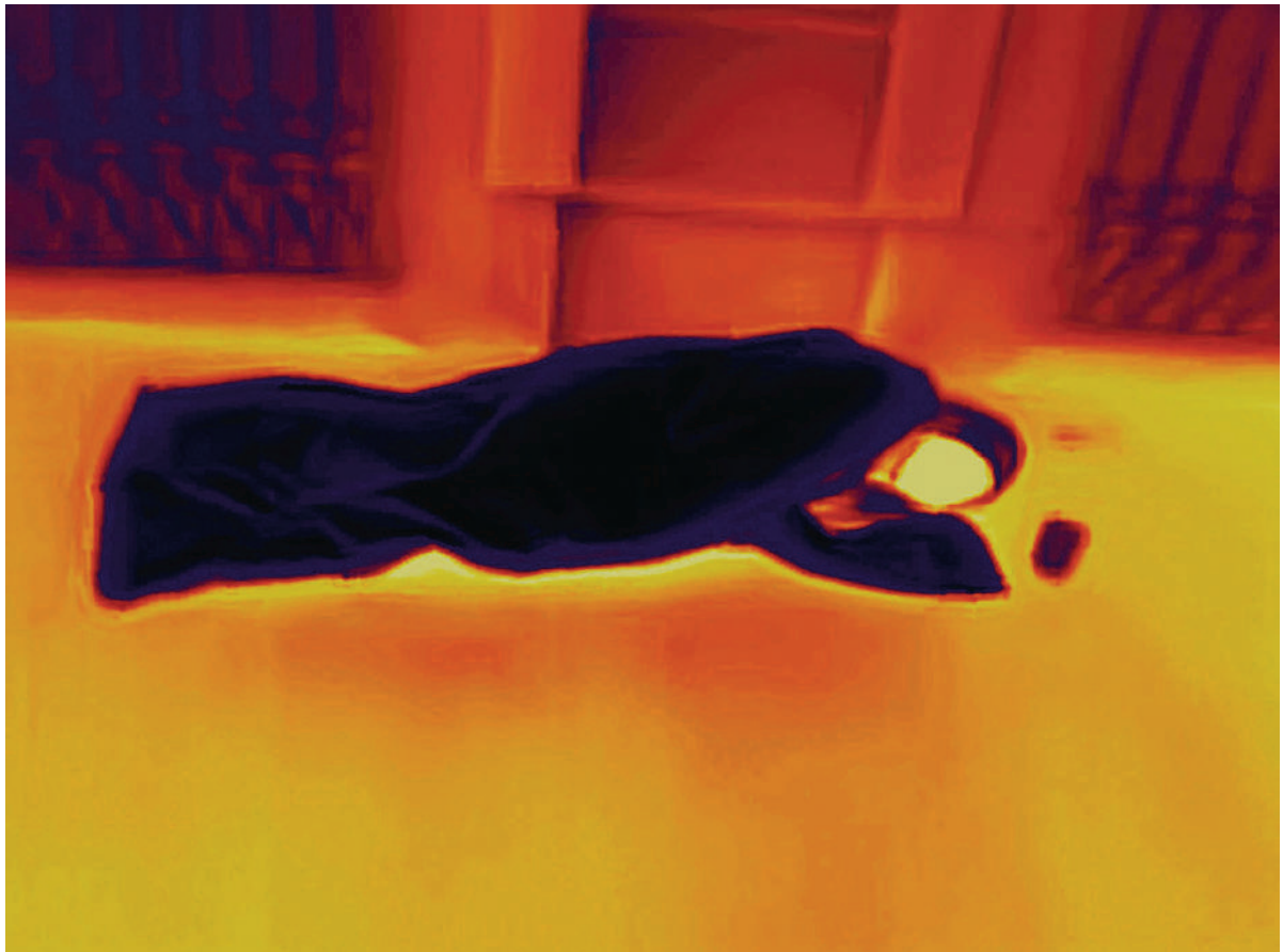
Gare du Nord, Paris. 13 Avril 2020

Antoine d'Agata est représenté par l'agence Magnum Photos et la Galerie Les filles du calvaire, Paris.