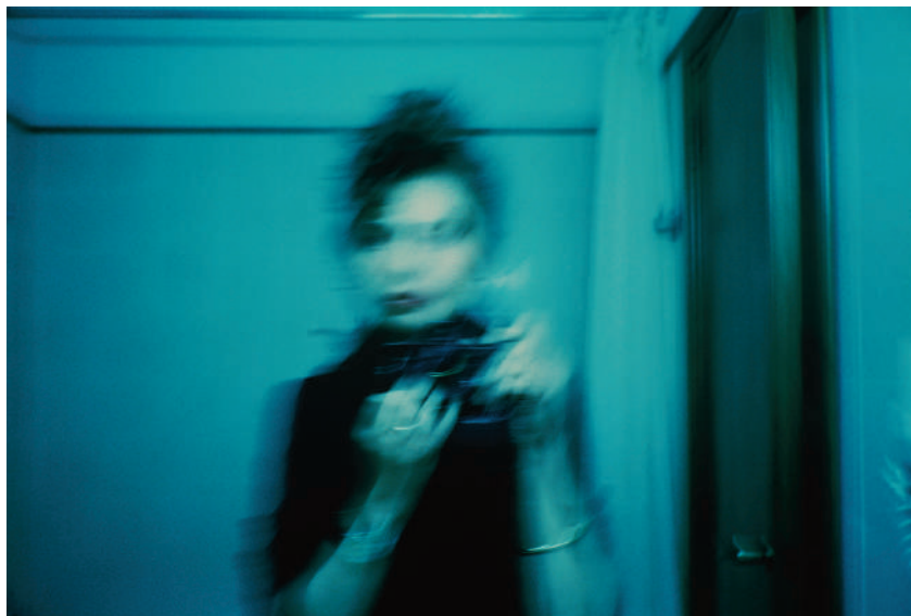
Autoportrait, Paris, 2000.