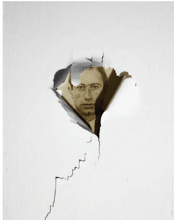
Sans titre, Tanger, Novembre 1950