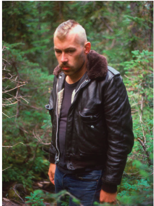
Horpe Area (Heino), Waterton Lakes, California. 1978 (rediscovered 2013)