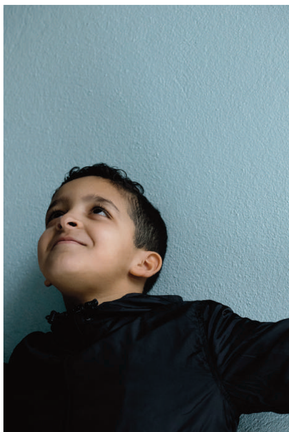
C comme Ciel. Portrait(s) - Edition 2021

Les photographies sont présentées sous forme d'une ronde extérieure sur les vitres qui entourent la Source de l'Hôpital, un des nouveaux lieux d'exposition de cette édition.