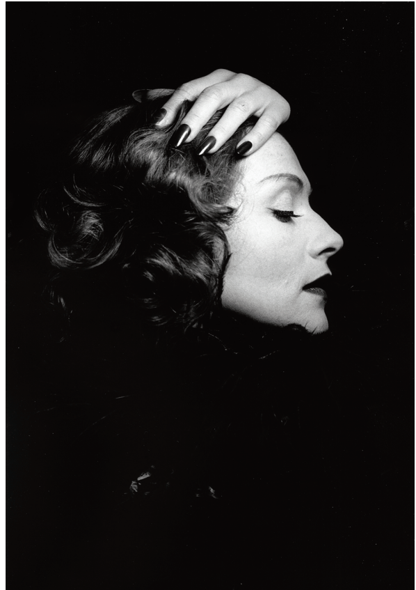
Isabelle Huppert en Marlène, 1994