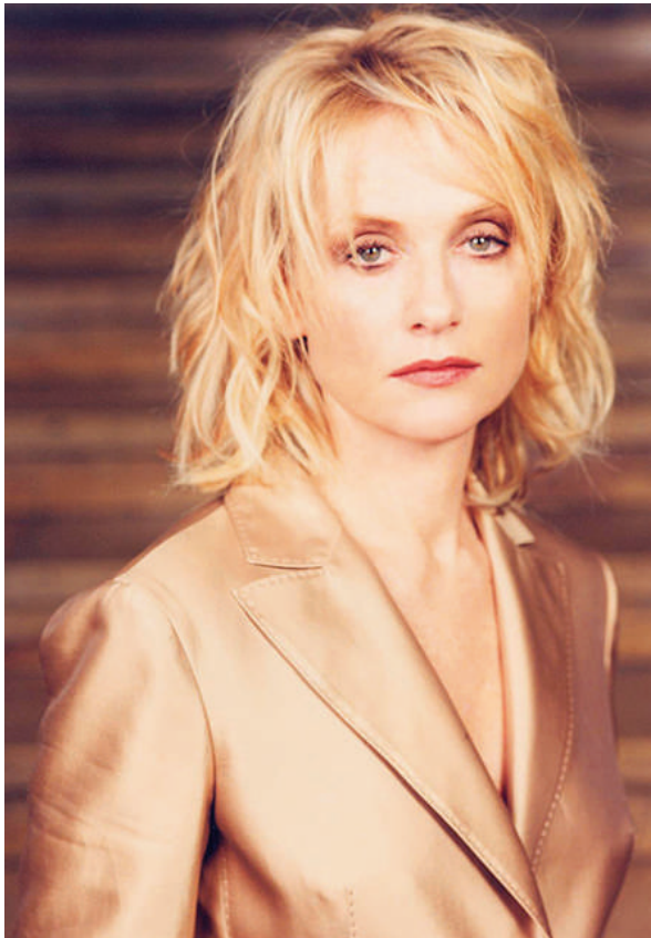
Au Trocadéro, 2001.