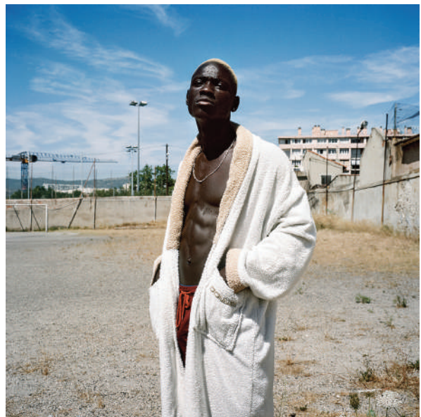
Courage. Marseille, 2019. Série Manger tes yeux